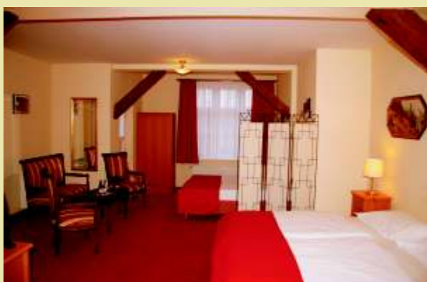
Blick in ein Familienzimmer