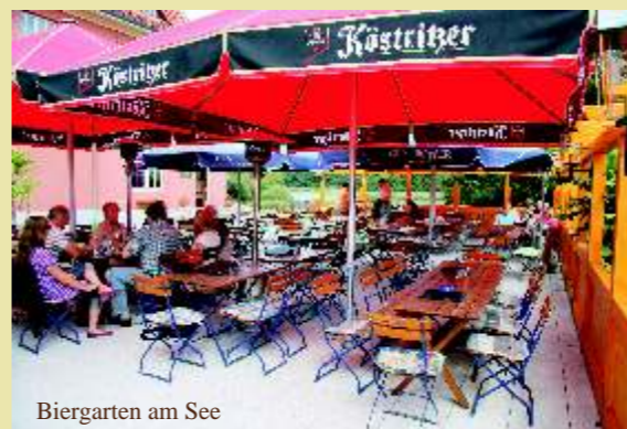
Biergarten am See

In allen Gasträumen sowie dem Gartenrestaurant servieren wir Ihnen unsere Grillspezialitäten vom Barbecue Grill, sowie Fisch-, Fleisch- und Wildspezialitäten aus heimischen Wäldern und Seen. Alle gastronomischen Einrichtungen sind ebenerdig und behindertengerecht.