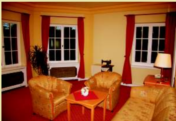
Blick in die Suite

Die Suite hat einen extra Schlafbereich.