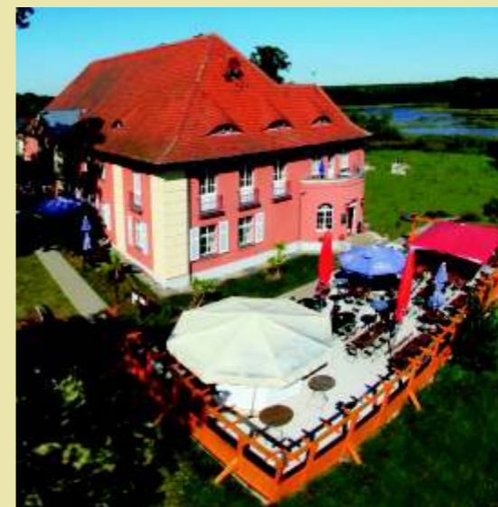
Hotel "Altes Gutshaus Federow" und Gartenrestaurant "Gutshausgarten"