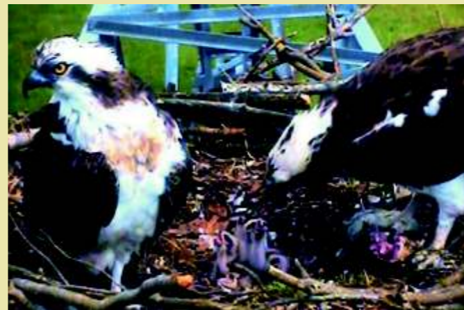
Fischadler beim Füttern der Jungen.

Ob im Frühjahr, wenn die Fischadler in den Müritz-Nationalpark kommen und bis zum Juli bleiben die Ankunft der Kraniche ab Mitte August oder einfach nur relaxen und ausspannen - für jeden ist ein passendes Angebot dabei.