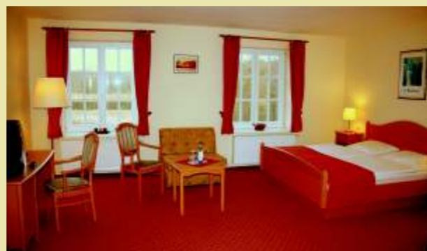
Blick in ein Doppelzimmer

Wir bieten ganzjährig verschiedene Arrangements an.