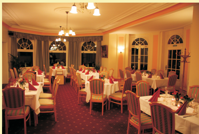
Restaurant Seeblick bei Feierlichkeiten

Für Ihren besonderen Anlass finden Sie bei uns die passenden Räumlichkeiten mit dazugehörigem Service. Wir richten Familienfeiern, Hochzeiten, Betriebsfeste und Veranstaltungen aller Art aus. Fragen Sie uns !!!