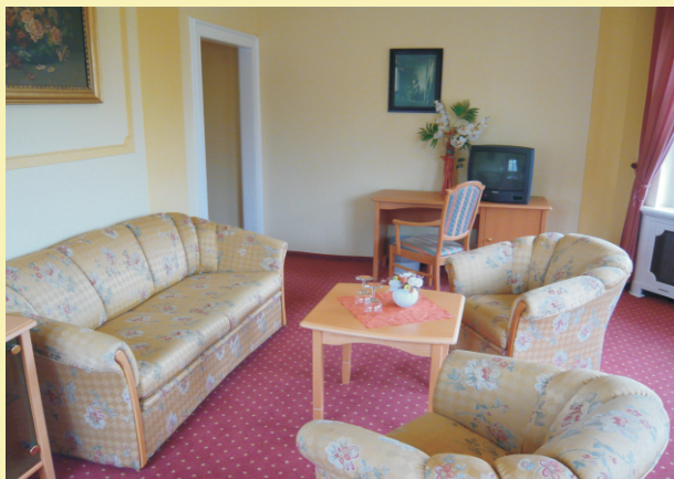
Blick in die Suite

Sie übernachten in stilvoll eingerichteten Zimmern, von denen einige mit Balkon ausgestattet sind.