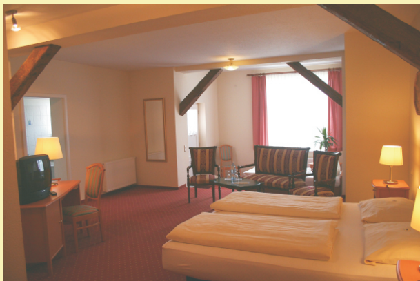
Blick in ein Doppelzimmer