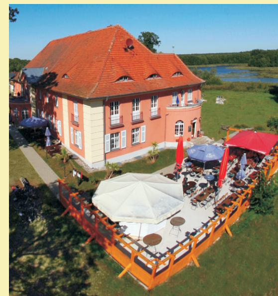
Hotel „Altes Gutshaus“ Federow und Gartenrestaurant „Gutshausgarten“

Nach einem schmackhaften Gericht aus der mecklenburger Küche - oder frischen Grillgerichten vom Barbecue Grill im Gutshausgarten lädt der Hofsee direkt hinter dem Haus zum Spazieren und Erholen ein.